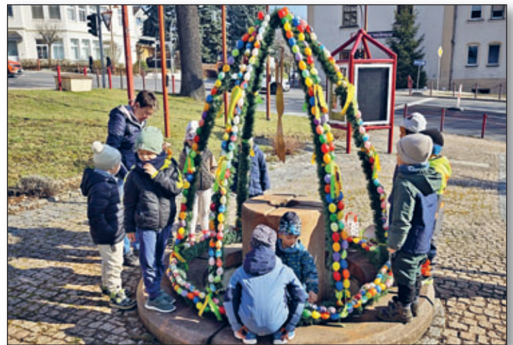
Auch beim Ausschmücken des Osterbrunnen halfen die „Spatzen“ fleißig mit.