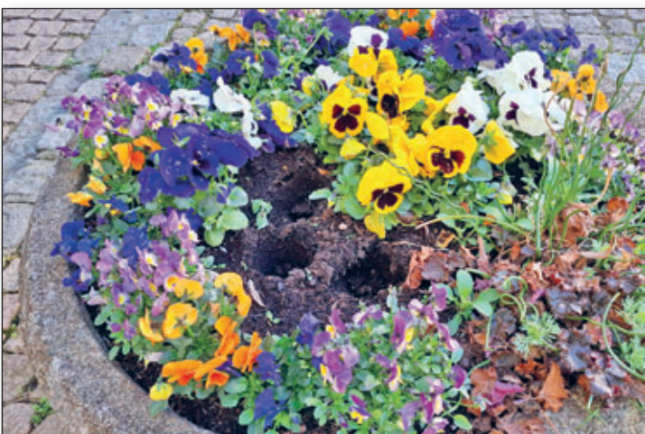
Leider ist es auch schon Tradition, dass Stiefmütterchen auf den Verkehrsinseln der Lichtensteiner Straße oder, wie im Bild, vor dem Rathaus geklaut werden!