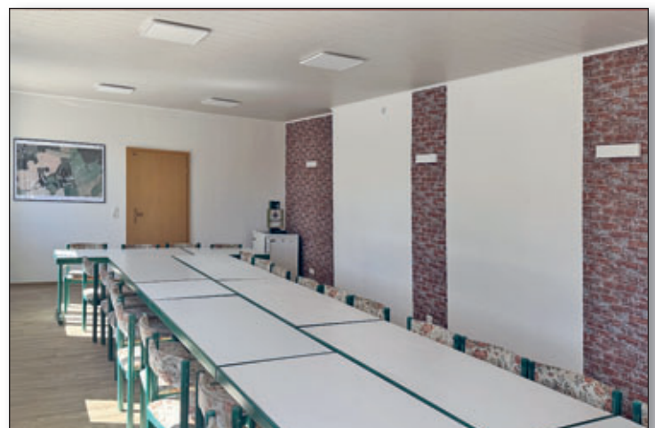
Aus ehemaligen Büroräumen der Alten Ziegelei entstand durch den Förderverein mit Unterstützung durch den Bauhof des Eigenbetriebes ein ansprechendes Vereinszimmer.