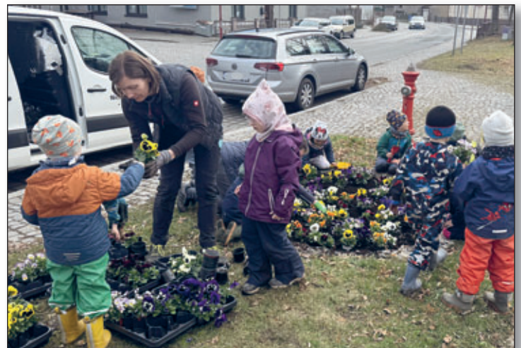
Die Mitarbeiter des Bauhofes führten die Frühjahrsbepflanzung durch. Gemeinsam mit Kindern vom Spatzennest wurde schon fast traditionsgemäß das Rundbeet vor der Apotheke gestaltet.